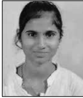
ലിൻഷ എ. മാർ ഗ്രിഗോറിയോസ് തൈമറവുങ്കര ലളിതാനം ഭദ്രാസനം 2nd